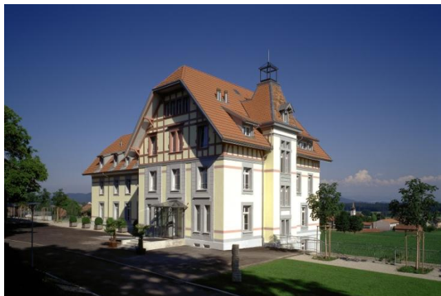
Haupthaus Klinik südhang

Die Klinik südhang in Kirchlintach ist eine auf die Behandlung von alkohol- und medikamentenabhängigen Frauen und Männern spezialisierte Fachklinik. Mit rund 66 Betten deckt die Klinik vom qualifizierten Entzug bis zu mehrmonatigen Entwöhnungstherapien die ganze Behandlungskette ab. Im dazugehörigen Ambulatorium im City Notfall in Bern werden ambulante suchtmmedizinische Abklärungen und Therapien angeboten.